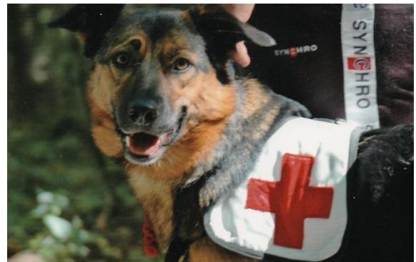
Cane da ricerca