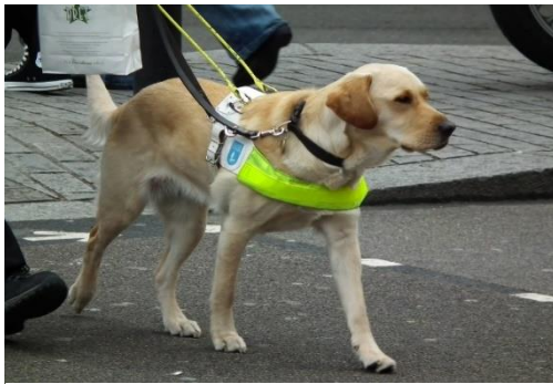
Cane conduttore non vedenti