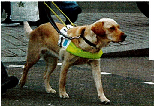
Cane conduttore non vedenti

Sarebbe buona educazione, quando incontriamo cani di conduttori di non vedenti, cani da ricerca, cani poliziotto, cani che hanno attaccato al loro guinzaglio o al collare un fiocco giallo, nelle zone permesse ai cavallieri, in zone con presenti altri animali: RICHIAMARE E LEGARE IL VOSTRO CANE.