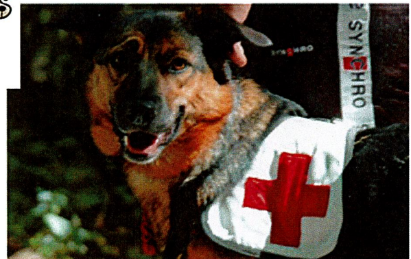
Cane da ricerca

Ringraziamo tutti per il massimo rispetto di queste elementari regole di comportamento.